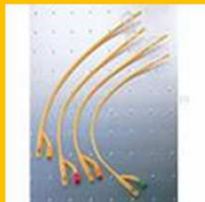
SONDES, DRAINS, TUBULURES