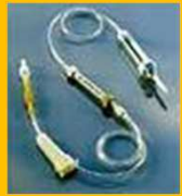
TUBULURES DE PERFUSION

Contact avec du sang ou un autre liquide biologique potentiellement infectieux