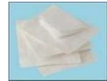
COMPRESSES NON SOUILLEES, EMBALLAGES KITS pansements