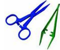
MATERIEL à PANSEMENT