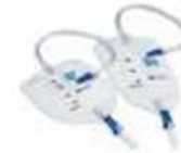
POCHES PERFUSION/ URINES VIDEES